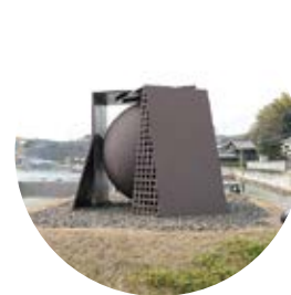
7 球を包む幕舎／保田春彦