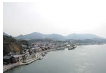
高根大橋からみた瀬戸田