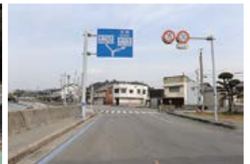
瀬戸田の中心部へ向かいます