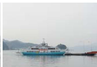
岩城島へのフェリー