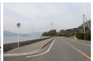
多々羅大橋が見えてくる