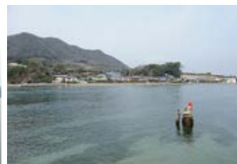
亀の首岩と地藏さん