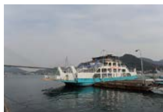
因島へのフェリー