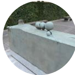
5 海からの贈物 ／山本正道