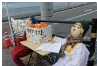
みかんの無料サービス