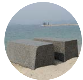
11 ねそべり石／山口牧生