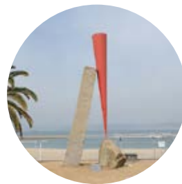
13 風のととき 赤いかたち / 傾 ／植松奎二