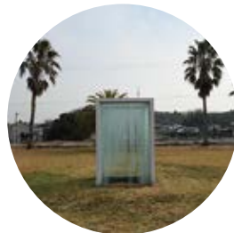
2 地上と地下の間で ／崔在銀