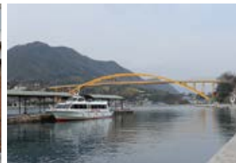
瀬戸田港と高根大橋