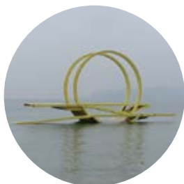
16 ベルベデールせとだ ／川上喜三郎