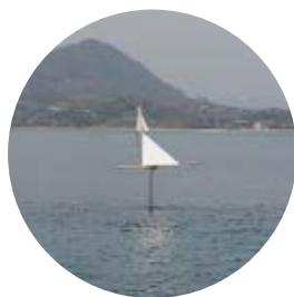
9 波の翼／新宮 普