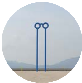
8 千里眼”のぞいてみよう、瀬戸田から世界が見える。” ／松永真

この区間には7点の美術品があります。瀬戸田サンセットビーチに8、12、13が設置されていて、サンセットビーチを歩くと、どれも見つかりますよ。9、10、11は瀬戸田に向かう途中にあります。11は浜辺の水際にあり、少し見つけづらいですが、いずれも県道81号線から見える範囲にあります。7は今回の区間とは少し離れた高根大橋を渡った北側です。