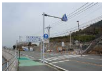
多々羅大橋へのサイクリングロード

があったりもします。瀬戸田サンセットビーチへの国道317号線は海に近い走りやすい道。しまなみ海道ならではの景色が楽しめます。