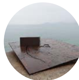
14 空／海 ／海老塚耕一

D \xrightarrow[約7分]{1.8km} A 多々羅大橋から瀬戸田サンセットビーチまで