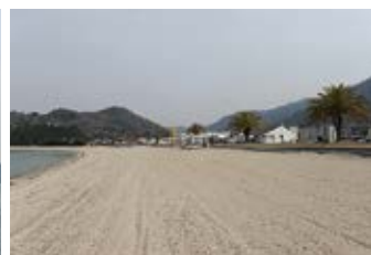
瀬戸田サンセットビーチ