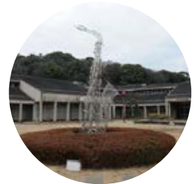
6 風の中で（瀬戸田） ／西野康造