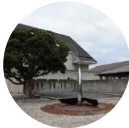
4 一羽の鳥の為に ／田中信太郎