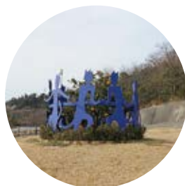
15 CATS DANCE ／滑川公一