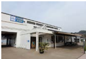
瀬戸田サンセットビーチ

うです。ここを過ぎると海沿いの道が続きます。緑色に塗られたサイクリングロードのすぐ横は海で、大三島が見え、しばらくすると高根島が見えてきます。しまなみ海道を満喫できる気持ちのよいコースです。瀬戸田町中心部の途中には小さな漁港があり、古い石組みの防波堤が目を引きま